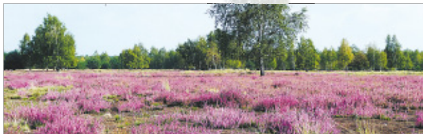
Im Zentrum des Naturparks, eingebettet in einen großen Waldkomplex aus Birken, Kiefern und Traubeneichen, hat ein ehemaliger Truppenübungsplatz eine offene Landschaft hinterlassen.

„Sagenhafte Wasserwelt im Naturschutzgebiet Loben“ ist Titel eines Fotos des Lausitzer Fotografen Frank Trosien. Landwirtschaft und Bergbau haben dem 1981 unter Naturschutz gestellten Gebiet lange Zeit Wasser entzogen. Bis 2007 wurde Torf als Heilmittel für den Kurbetrieb abgebaut. Heute greifen Wiedervernässungsmaßnahmen – der Erfolg ist spürbar.