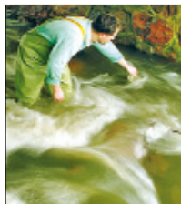
Lachsbesatz in der Prignitz Stopenitz.