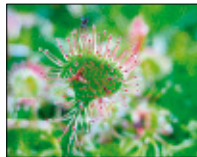
Der Sonnentau ergänzt seinen Speisezettel durch Insekten.