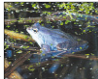
Wenn das Moorfroschmännchen blau wird, will es sich paaren.